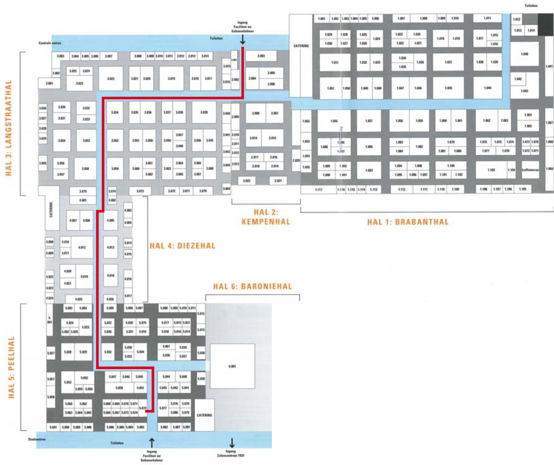
Plattegrond Vakbeurs Facilitair